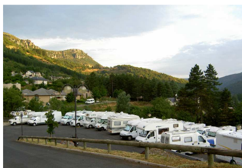
L'area di sosta di Florac.