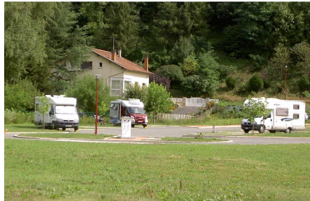
L'area di sosta di Boisset – Penchot.

Nel pomeriggio partiamo alla volta di Figeac, dove pensiamo di sostare per la notte. L'area di sosta è però lungo una strada trafficata, piccola ed in pendenza...insomma non ci convince! Ripartiamo per la prossima meta (Conques) e lungo il percorso ci fermiamo in una piccola e deliziosa AA nel paese di Boisset – Penchot , lungo il Lot.