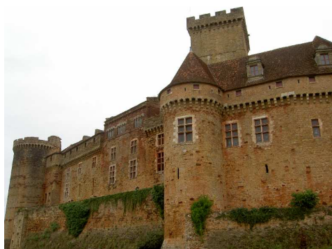
Il Castello di Castelnau – Bretenoux.

La mattinata è dedicata alla visita del vicino Castello di Castelnau – Bretenoux (6,5€ a persona): la visita degli interni è guidata, mentre quella degli esterni è libera.