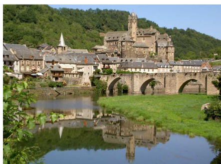
Estaing ed il Lot.

Pranziamo al parcheggio e ripartiamo seguendo la stretta e tortuosa D107 che segue le anse del Lot, passiamo per Entraygues sur Truyère e per Estaing : il paese merita assolutamente una sosta, anche solo per immortalarlo mentre si specchia nel Lot!