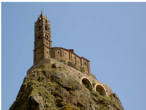
Aiguille Saint Michel a Le Puy en Velay.

Seguendo la D590, attraversando zone montane molto suggestive, raggiungiamo Le Puy en Velay : in centro il traffico è intenso e l'area di sosta occupata da un mercato, preferiamo quindi sistemarci nel Camping municipale Le Bouthezard, nei pressi della Aiguille Saint Michel, al costo di 16 € al giorno.