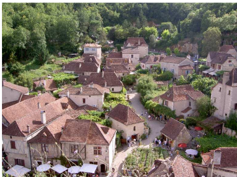
Il paese ed il panorama verso il Lot visti dal belvedere che domina Saint Cirq Lapopie.

Per raggiungere il centro del paese seguiamo il percorso pedonale che si arrampica fino al meraviglioso villaggio: la fatica viene ampiamente ripagata dai panorami e dagli scorci che questo paesino sa offrire!