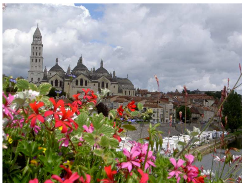
La Cattedrale di Perigueux ed il parcheggio per camper visti dal ponte Saint Georges.

In mattinata ci spostiamo a Perigueux , sistemiamo il camper nella AA segnalata lungo il fiume Isle, nei pressi del ponte Saint Georges e visitiamo l'animato centro, dominato dalla maestosa Cattedrale.