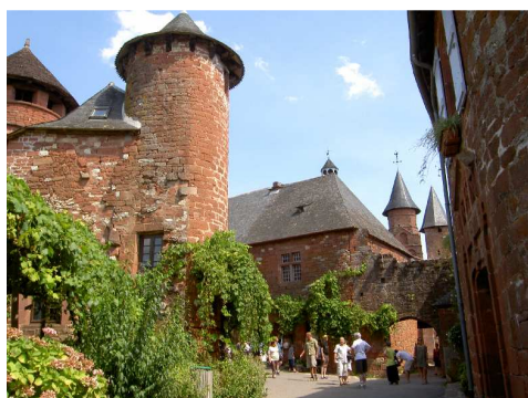
Collonges la Rouge.

Proseguiamo per Beaulieu sur Dordogne e la visitiamo, concentrandoci particolarmente sulla sua chiesa romanica, che presenta un portale riccamente scolpito. Prima di cena ci spostiamo a Saint Céré , ci sistemiamo nella AA gratuita vicino allo stadio di rugby ed al cimitero e facciamo una breve passeggiata.