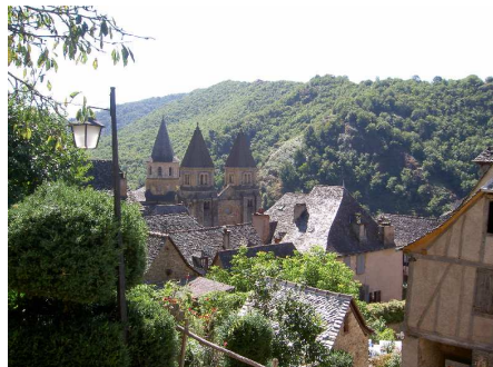
Panorama di Conques.

Ci spostiamo a Conques e parcheggiamo al costo di 3€ nell'unico grande P a disposizione (gli addetti alla sosta ci consigliano di sistemarci alla fine del P, con il muso rivolto verso l'uscita, perché è facile rimanere imbottigliati tra le macchine). Visitiamo il meraviglioso centro, ricco di scorci ed impreziosito dalla magnifica chiesa di Sainte Foy (in particolare dal mirabile rilievo del timpano del portale ovest).