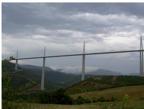
Il viadotto di Millau.

Terminate le gole ci fermiamo ad ammirare l'avveniristico Viaduc di Millau ed il suo centro visitatori...impressionante!