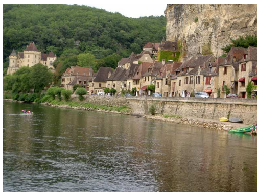
La Roque Gageac e la Dordogna.

Poco prima delle 9 ci dirigiamo verso il sito trogloditico di La Roque Saint Christophe : apre solo alle 10 e quindi lo vediamo solamente dalla strada. Proseguiamo per Les Eyzies de Tayac (già visitata nel 2003) ed arriviamo a Beynac et Cazenac : il parcheggio gratuito per i camper si trova in alto sopra il paese, ma si raggiunge senza problemi. Visitiamo il bel centro e saliamo fino al Castello (la cui visita ci sembra abbastanza cara..7€..visto che si è costretti a seguire una guida che parla unicamente francese). Dopo pranzo ci spostiamo nella vicina La Roque Gageac , parcheggiamo nel P per camper lungo la dipartimentale 703 (2€ per il giorno e 5€ per la notte) e visitiamo il paesino arroccato e quasi a strapiombo sulla Dordogna.