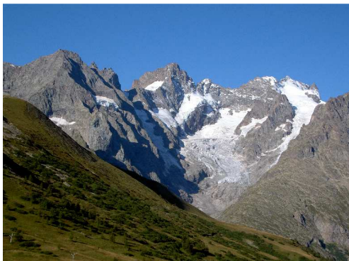
Il ghiacciaio della Meije.

Dopo aver immortalato il ghiacciaio della Meije, che si mostra in tutta la sua bellezza baciato dal sole, raggiungiamo Briançon .